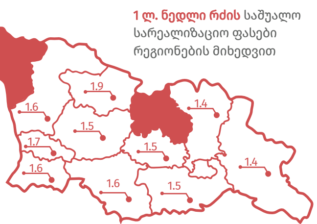
1 ლ. ნედლი რძის საშუალო სარეალიზაციო ფასები რეგიონების მიხედვით

გაძვირებული საქონლის საკვებისა და არახელსაყრელი ამინდებიდან გამომდინარე რძის წარმოება შემცირდა, თუმცა, ამავდროულად, მყიდველების უმეტესობა არ არის მზად 1 ლიტრ რძეში 1.8 ლარი გადაიხადოს.