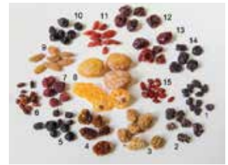
არაბასიური წარმოების ჩირი