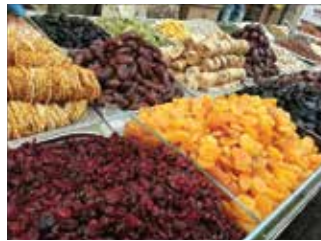
ჩირი ქუჩის ბაზრის დასლაზგა