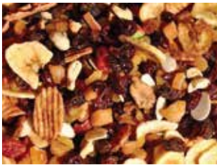
სხვადასხვა ხილის ჩირის მიქსი