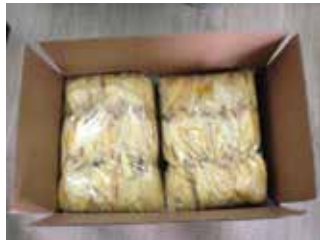
სურათი 4: ბანგოს ჩირის საექსპორტო შეფუთვა

ტენდენცია ვლინდება ისეთ პროდუქტებზე, როგორცაა ნუში, თხილის სხვადასხვა სახეობა (მათ შორის, ბრაზილიური, მაკადამიის) და ევროპული ქლიავის ჩირი.