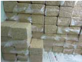
სურათი 3: ქაშის საექსპორტო შეფუთვა

საკალო შეფუთვის სახეობები: პოლიეთილენის პაკეტები, პლასტმასის ყუთები და ფოლგის პაკეტები.